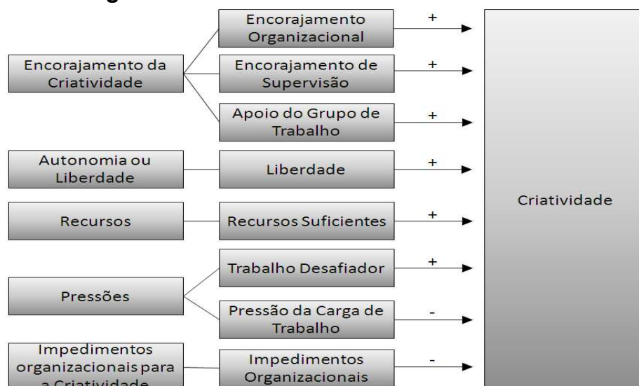
Figura 3: Dimensões influenciadoras da criatividade

Amabile et al. (1996) identificaram práticas influenciadoras da criatividade que podem ser entendidos como dimensões facilitadores e inibidores da criatividade, conforme a Figura 3.