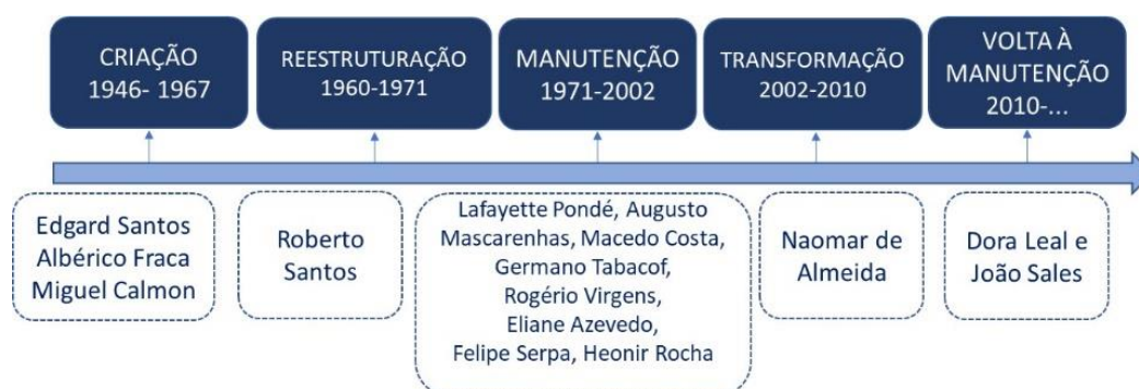
Figura 1- Ciclos históricos e reitores da UFBA